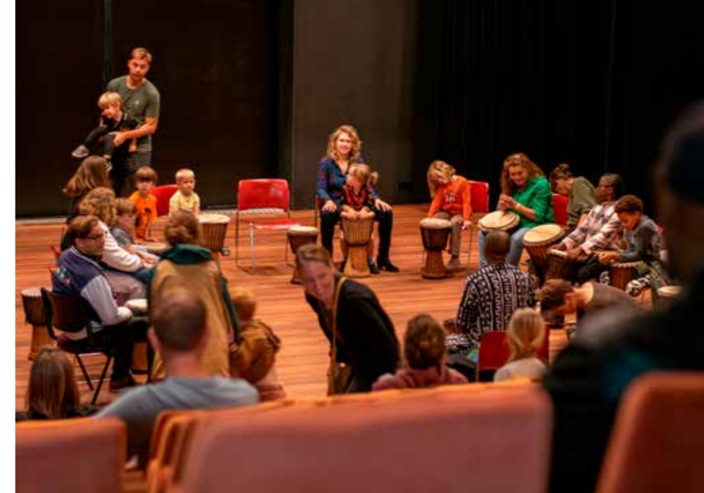
Leuk filmpje De Buurt Pakt Uit - Zonfestival: https://youtu.be/fxghxDgwASA?feature=shared