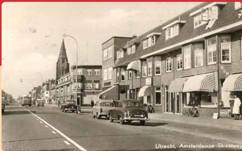
TEKST ED LASSEUR