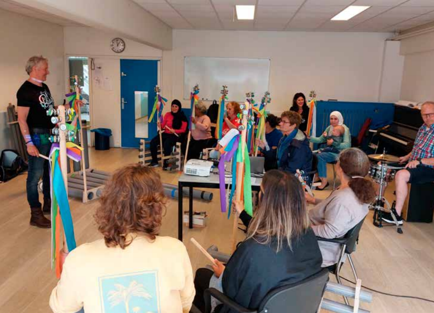
TEKST ED LASSEUR