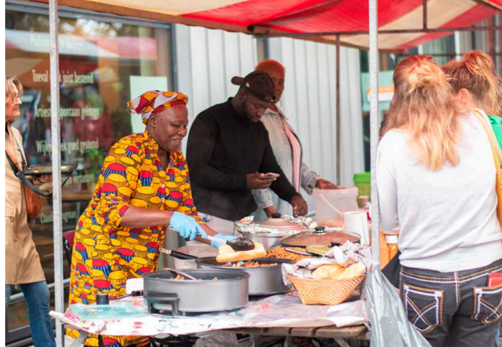
TEKST ED LASSEUR