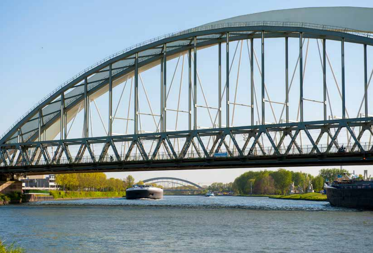
TEKST BIRGIT OELKERS Plan en Aanpak, community builder